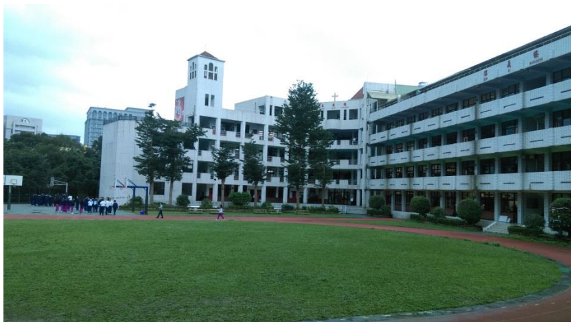
圖(一)飛行競賽場地