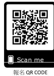
報名 QR CODE